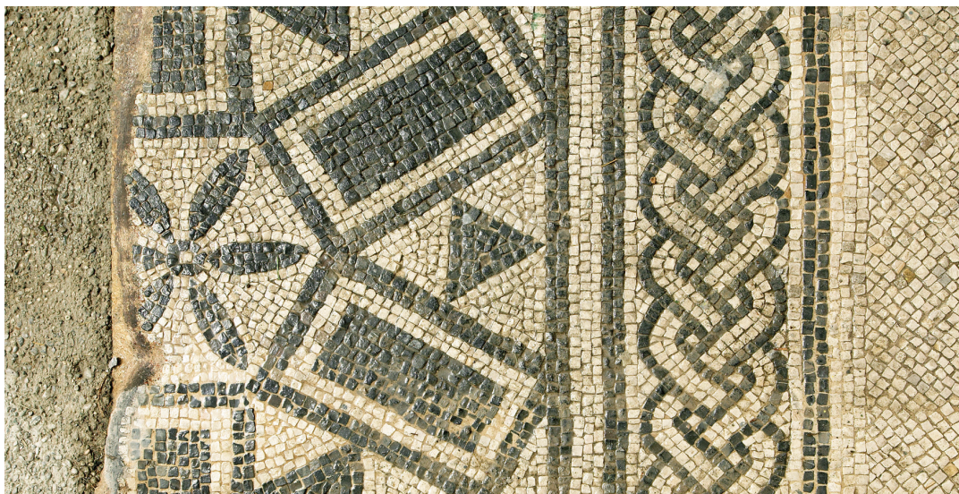
Slika 3: Detajl mozaika v arheološkem parku Emonska hiša.

Stojimo ob mozaikih ob južnem emonskem obzidju.