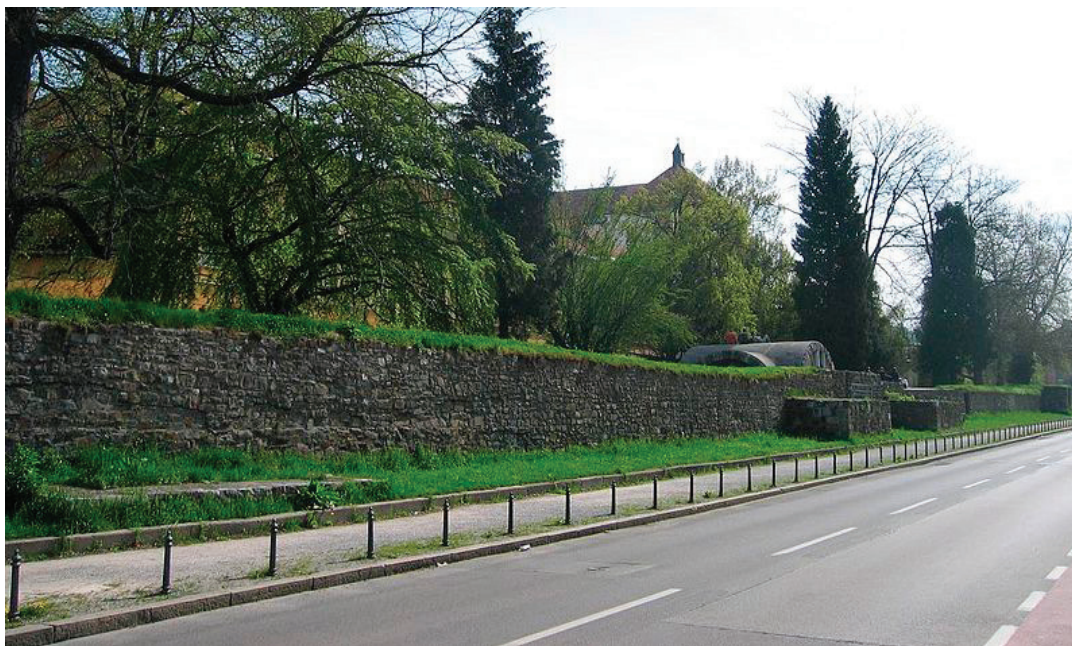
Slika 2: Obnovljena južna stran emonskega obzidja na Mirju po načrtih arhitekta Jožeta Plečnika.