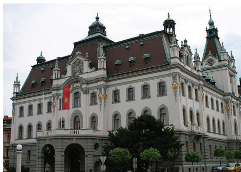
Slika 11: (Poslopje Univerze v Ljubljani.)