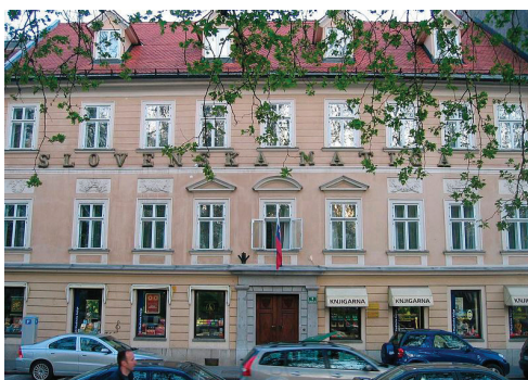
Slika 12: (Poslopje Slovenske maticе.)