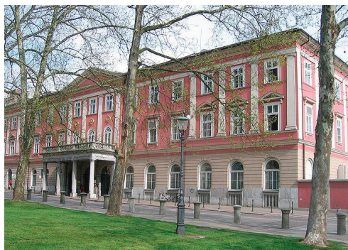
Slika 9: (Kazina.)