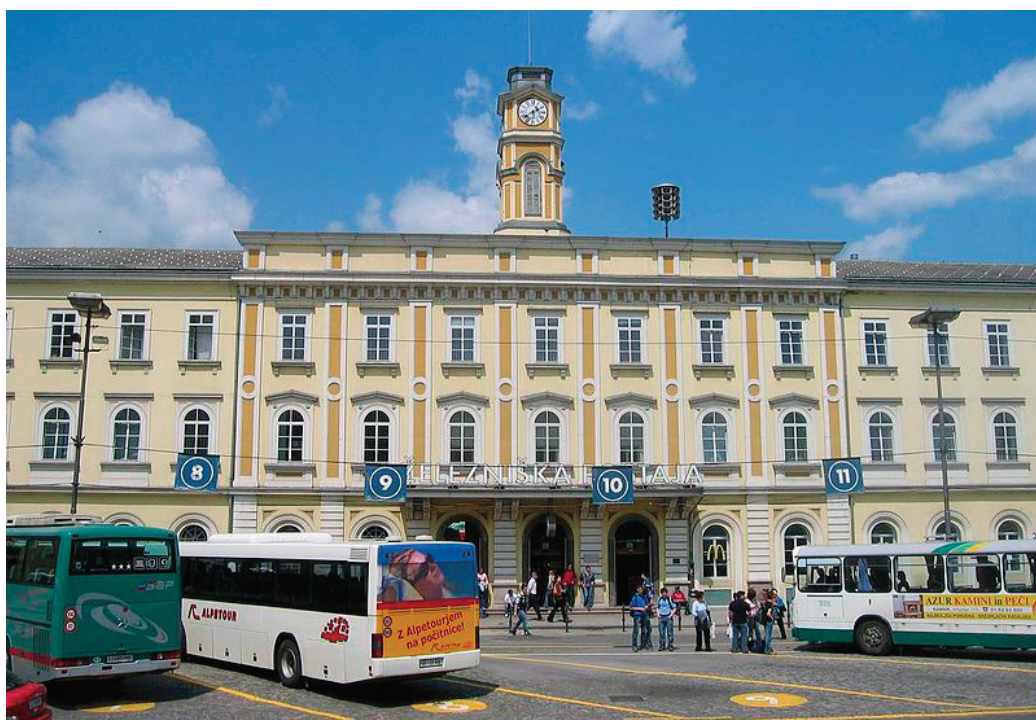
Slika 7: Železniška postaja Ljubljana.

Oglej si pročelje stavbe in zapiši njene glavne arhitekturne značilnosti.