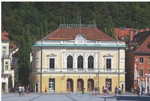
Slika 10: (Slovenska filharmonija.)